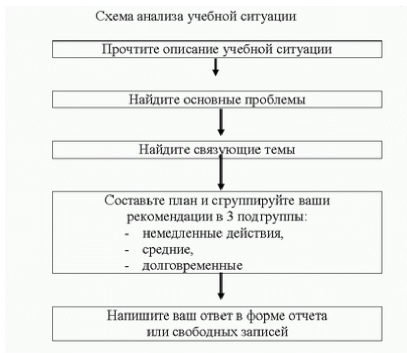
Схема анализа учебной ситуации

Шкала и критерии оценивания результата учебной ситуации, выполненной обучающимися, представлены в таблице